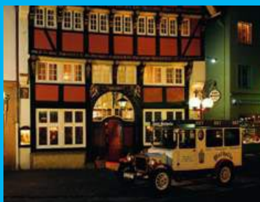
Romantik Hotel Walhalla****S

Einzelzimmer: 98 Euro Doppelzimmer: 119 Euro